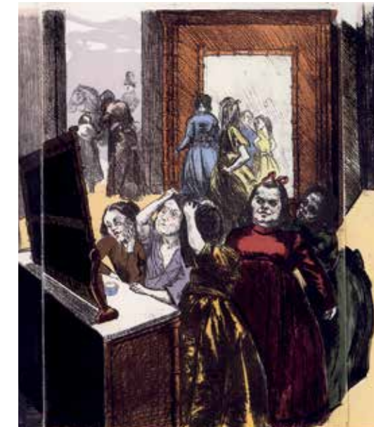
Getting ready for the ball, 2001. © Paula Rego Studio, courtesy Cristea Roberts Gallery.

Paula Rego, Power Games , tot 25 oktober in museum De Reede in Antwerpen. Info: museum-dereede.com