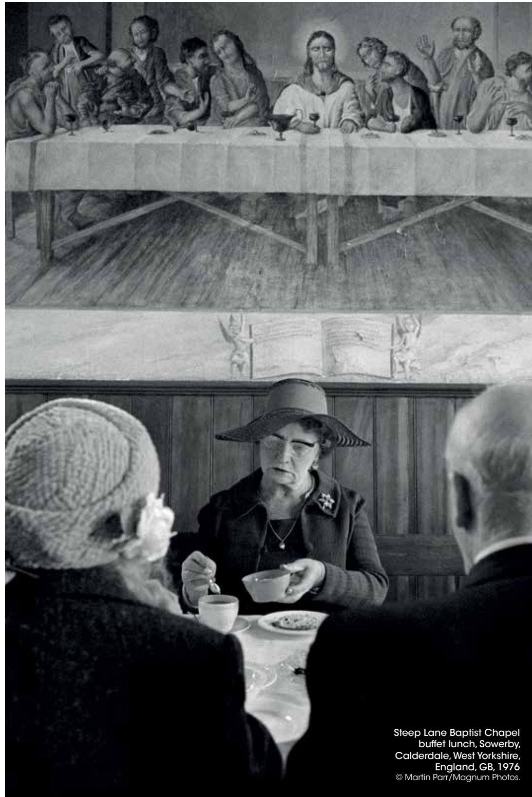
Steep Lane Baptist Chapel buffet lunch, Sowerby, Calderdale, West Yorkshire, England, GB, 1976 © Martin Parr/Magnum Photos.

Martin Parr, Parrathon, van 17 september tot 18 december in Hangar Photo Art Center, Kasteleinsplein 18 Brussel. Info: www.hangar.art