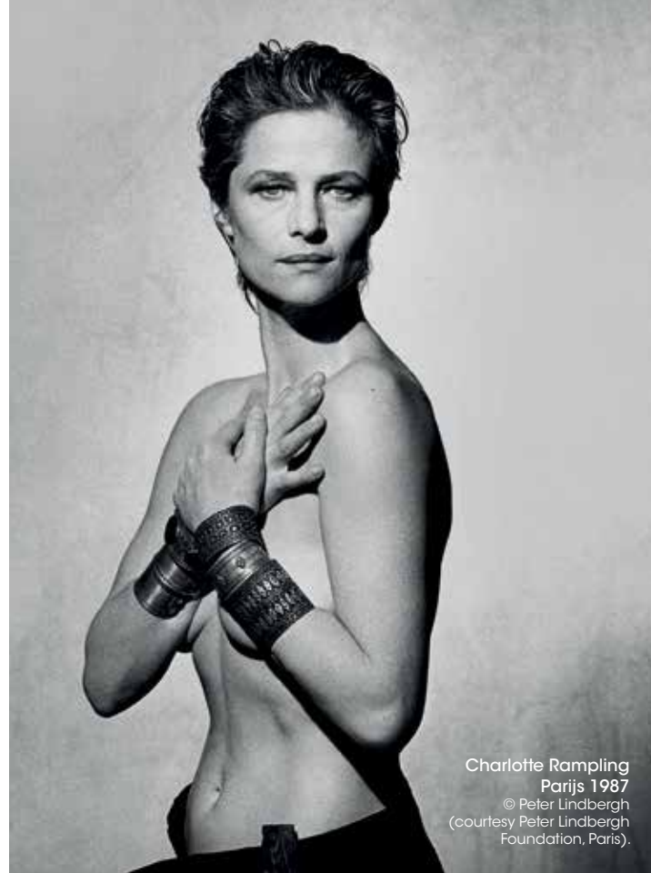
Charlotte Rampling Parijs 1987 © Peter Lindbergh (courtesy Peter Lindbergh Foundation, Paris).

"Hij was een pionier op het gebied van modiefotografie en introduceerde een nieuw realisme door de normen van schoonheid te herdefiniëren. Bij hem primeerde de persoonlijkheid van het model boven het fashiongehalte. Hij wilde de vrouw bevrijden van de terreur van jeugd en perfectie en hield van puurheid, eerlijkheid, authenticiteit, kortom van de natuurlijke schoonheid van de vrouw."